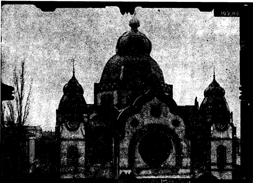
... és keleti oldala