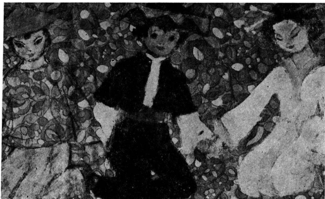
Népek barátsága (részlet)