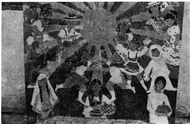
A szeretet triptichonja