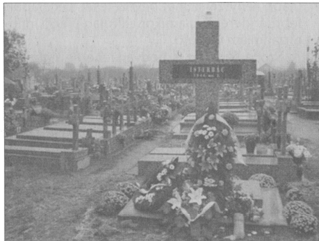
AZ ISTERBÁCI ÁLDOZATOK TISZTELETÉRE EMELT EMLÉKKERESZT A BEZDÁNI TEMETŐBEN

- Visszatérve beszélgetésünk témájához, az ártatlan magyar áldozatokról való megemlékezés kérdéséhez, a számos ismert adat ellenére is vannak még felderítetlen, de felderíthető mozzanatok. Az egyik ilyen,