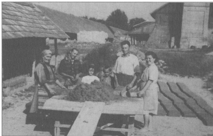
BAJMOKON LETELEPÜLVE A CSALÁD EGY MUNKÁS, ÚJ ÉLET REMÉNYÉBEN TEKINT A JÖVŐBE