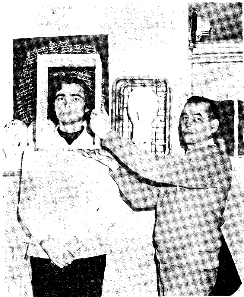
Kass János—Szombathy Bálint: Fej, Budapest, 1977