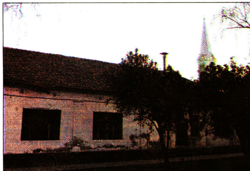
A moholi Hármas iskola napjainkban

és az apámhoz, megglazította a drótot, majd azt mondta: most. Miután meg szabadult, apám nem tudta, hogy hova menjen, mert ha hazamegy, akkor a megmaradt családját, a velem várandós feleségét, a kicsi lányt és a szomszédban élő nagynénjét életét sodorja veszélybe.