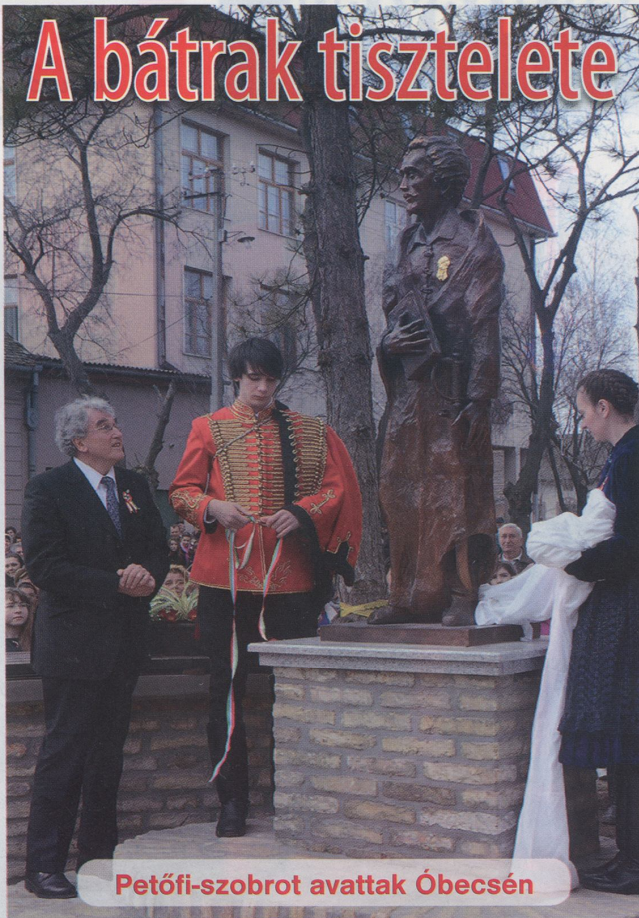
Petőfi-szobrot avattak Óbecsén